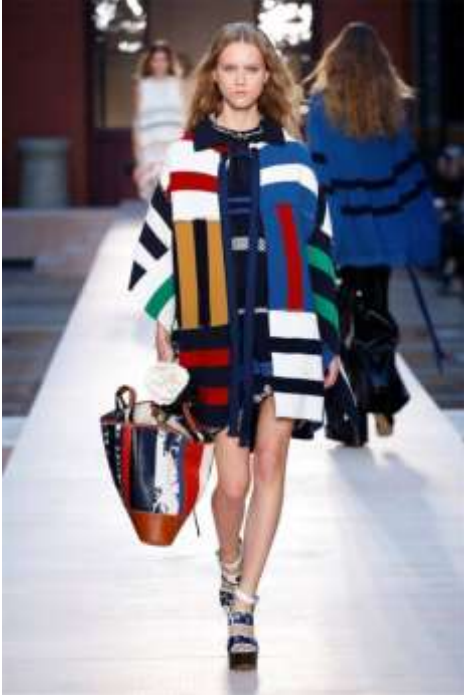
Nuestro icono de moda en punto: Sonia Rykiel